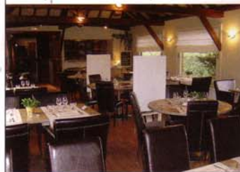
▲ La Brasserie des Acacias. La Brasserie Alizé reprendra le même style.